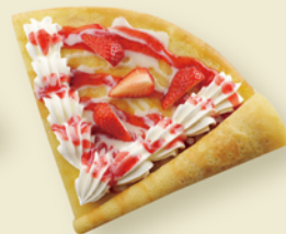
練乳いちごのクレープ ¥450

ソフトクリームトッピング + ¥100 すべてのクレープにソフトクリームのトッピングができます。