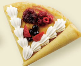
4種のベリー&ベリーの クレープ ¥450