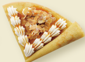
ローストアーモンドと 塩キャラメルのクレープ ¥400