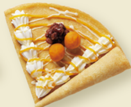
道産あびすかぼちゃと 十勝あずきのクレープ ¥420