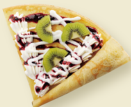
道産ハスカップとヨーグルト・ はちみつのクレープ ¥400