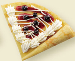
クリームチーズと ブルーベリーのクレープ ¥420