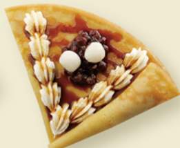
十勝あずきと白玉の 和風クレープ ¥400