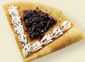
ほろにが珈琲ゼリーの クレープ ¥400