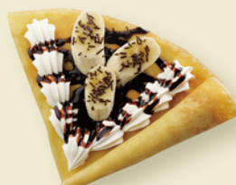
ミルクチョコレートと バナナのクレープ ¥400