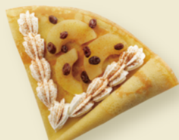
シナモンアップルと ラムレーズンのクレープ ¥400